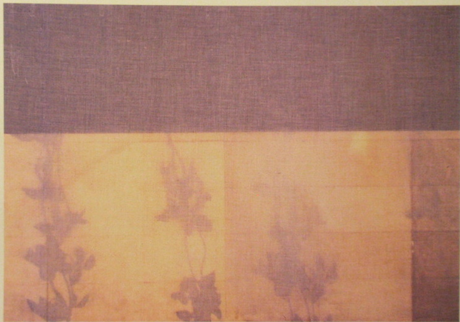
Sombra sobre sombra II Técnica: tela y papel medidas: 100 x 70